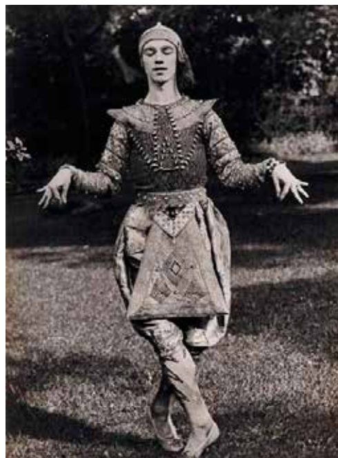
Nijinsky dans Les Orientales

Les Ballets Russes, célèbre compagnie d'opéra et de ballet, a été créée en 1907 par Serge de Diaghilev avec les meilleurs danseurs du théâtre Mariinsky de Saint-Petersbourg. Dès 1909, la compagnie entame une tournée internationale et, en 1911, Diaghilev coupe les ponts avec le Ballet Impérial Russe. La compagnie devient une troupe privée, indépendante, qui se fixe à Monte-Carlo, Paris et Londres. Michel Fokine et Vaslav Nijinsky étaient chorégraphes de cette compagnie.